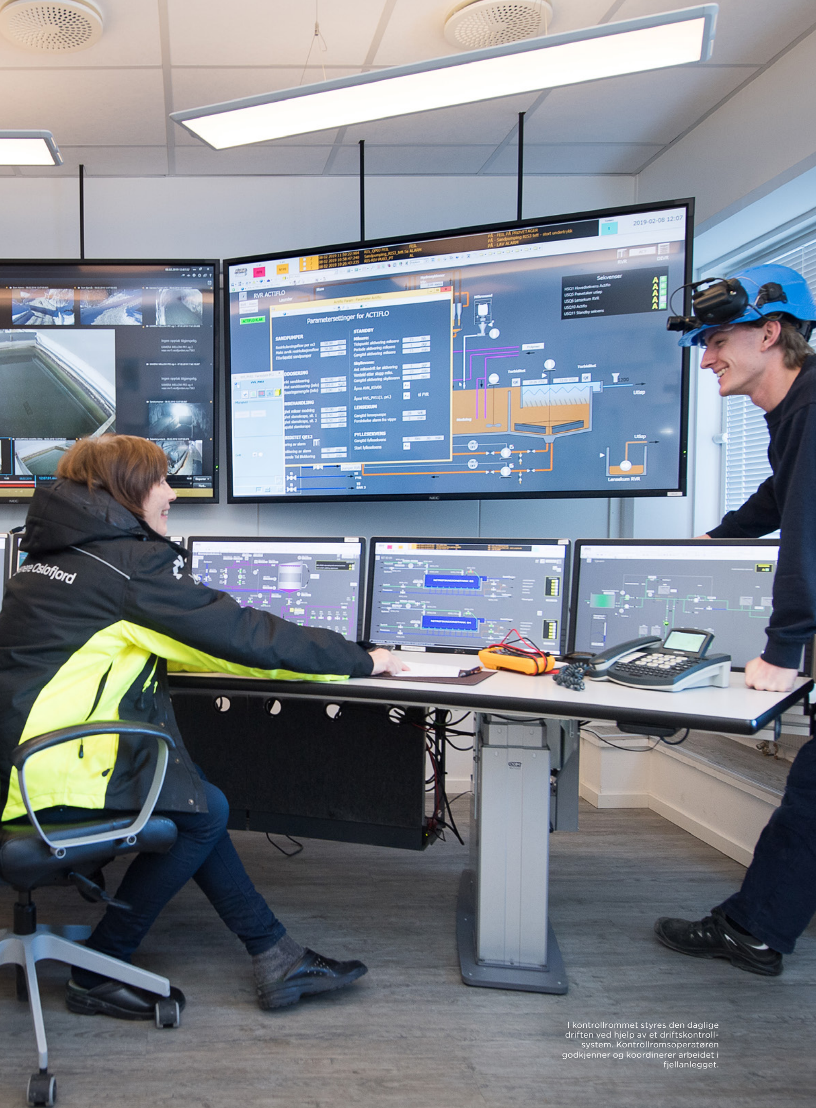
I kontrollrommet styres den daglige driften ved hjelp av et driftskontrollsystem. Kontrollromsoperatøren godkjenner og koordinerer arbeidet i fjellanlegget.