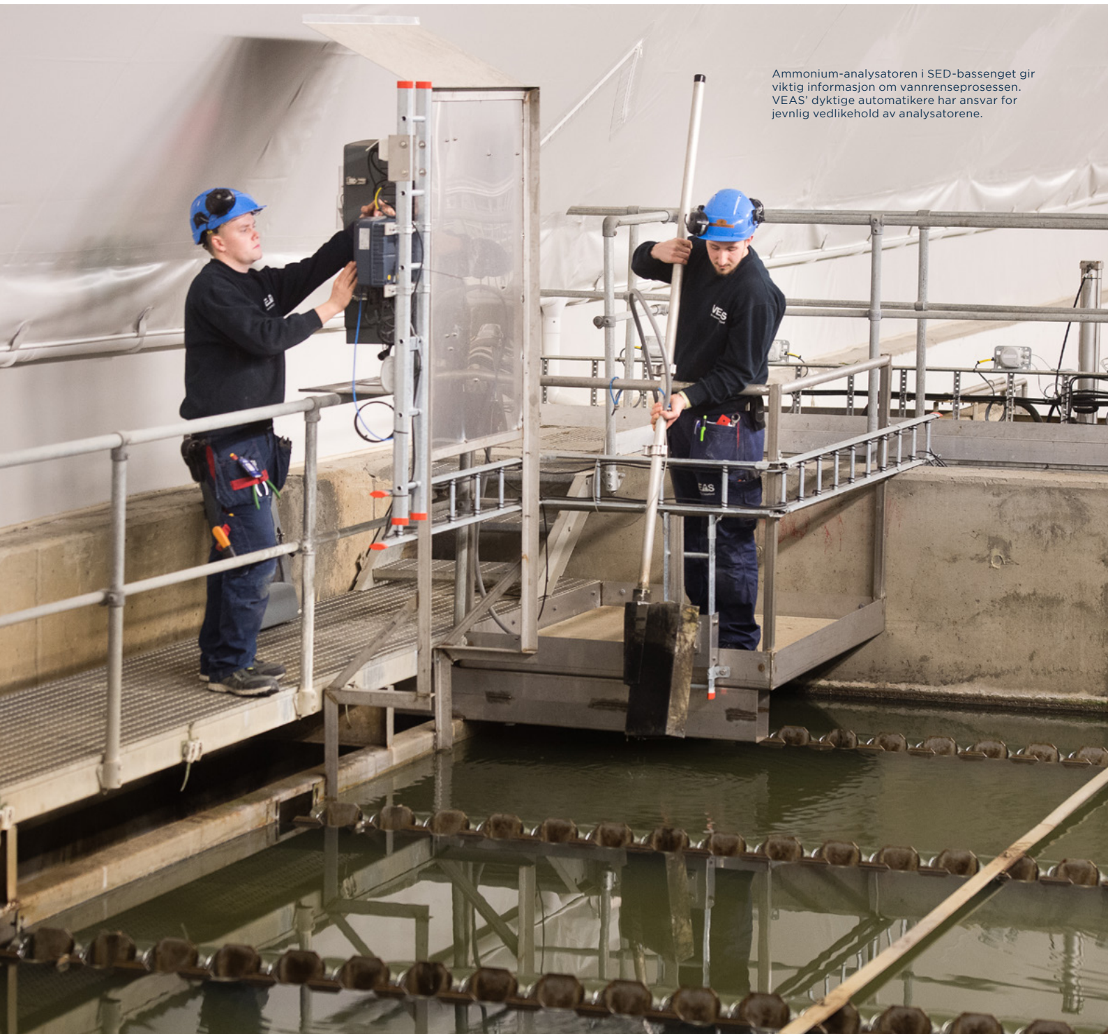
Ammonium-analysatoren i SED-bassenget gir viktig informasjon om vannrensprosessen. VEAS' dyktige automatikere har ansvar for jevnlig vedlikehold av analysatorene.

Avløpsvannet inneholder også tungmetaller, mikroplast og medisinerester i små mengder. For fremtiden kan det bli satt strengere krav til rensing for å fjerne slike uønskede stoffer i rensesprosessen. VEAS arbeider for å kartlegge omfanget av de uønskede stoffene og, om mulig, begrense problemene ved å stanse utslipp ved kilden.